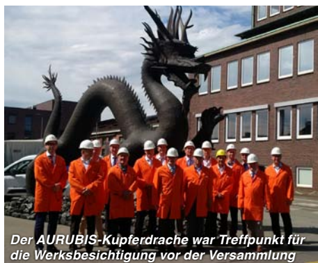
Der AURUBIS-Kupferdrache war Treffpunkt für die Werksbesichtigung vor der Versammlung