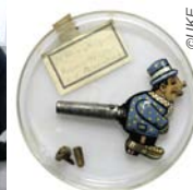
Exponat aus der Sonderschau „verschluckt und ausgestellt“ im UKE-Museum